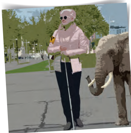
Frau mit Landstock, neben ihr der vielzitierte Babyelefant.

2020 stellte die Menschheit vor ungeahnte Herausforderungen. Der Alltag wurde umgekrempelt, neue Regeln bestimmten auf einmal das Zusammenleben und ein einziges Thema verschluckte plötzlich alle andere. Gerade deswegen war es wichtig, dass der BSVÖ eine Stimme behielt, die weiterhin gehört wurde.