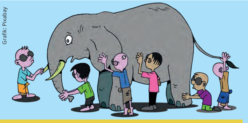
Cartoon von blinden und sehbehinderten Kindern, die einen Elefanten ertasten.

(exkl. Periodika und analoge Hörbücher).