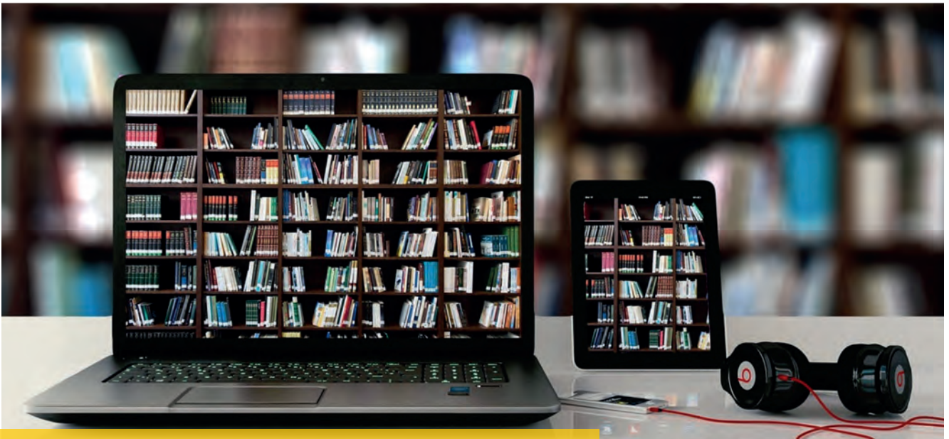
Viel Lesestoff: digitale Bibliothek am Laptop, Tablet und Player.

Selbst Länder wie die Mongolei verfügen über eine eigene Hörbücherei! Hörbücherei-Nutzer können darauf zugreifen und kostenlos über uns Werke bestellen.