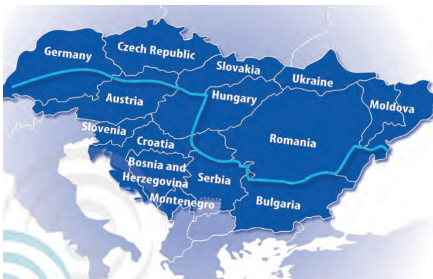
Grafik aller am DANOVA-Projekt teilnehmenden Länder.

Als österreichischer Projektpartner verfolgt der BSVÖ derzeit das Ziel, die Ausgewogenheit der Arten von Verkehrsstationen, die bei DANOVA in allen Phasen berücksichtigt werden, zu fördern. Im Moment bedeutet das, aktiv dazu beizutragen, dass beispielsweise auch regionale Verkehrsbetriebe vermehrt eingebunden und gute Beispiele rund um Straßenbahn- und Busstationen in die Sammlung aufgenommen werden. Dafür haben wir die besten Voraussetzungen, denn für die Mitarbeiterinnen und Mitarbeiter des GMI, die ja das mit dem Referat für barrierefreies Bauen eng verknüpfte Fachgremium für barrierefreie Mobilität im BSVÖ bilden, ist die Kommunikation mit Behörden und Verkehrsbetrieben in ihren Bundesländern an der Tagesordnung. Sie wissen, wo die Stärken und Schwächen der ihnen vertrauten Systeme liegen, und sie kennen die relevanten Ansprechpartnerinnen und Ansprechpartner. Und was am wichtigsten ist: sie haben den