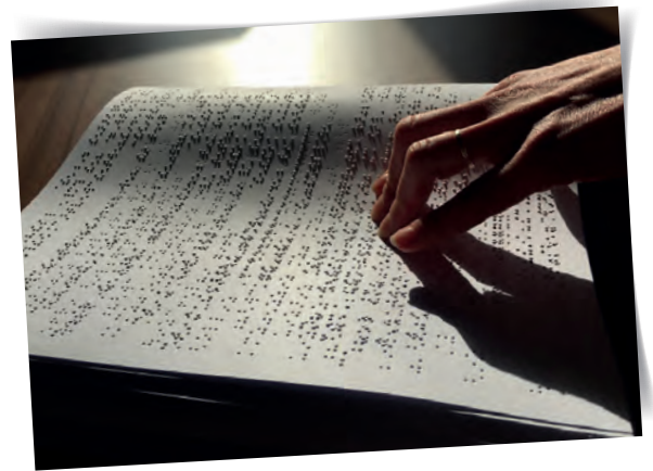
Ein Braille-Druck wird gelesen

Seit 1995 bin ich Vorsitzender der österreichischen Brailleschriftkommission und österreichischer Vertreter in dem 1998 gegründeten Brailleschriftkomitee der deutschsprachigen Länder.